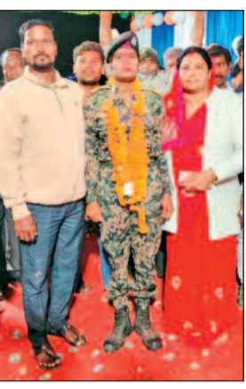
स्वागत में ग्रामीणों ने रैली निकाली, फूलमाला पहनाकर उनके साथ तस्वीरें भी खिंचवाईं